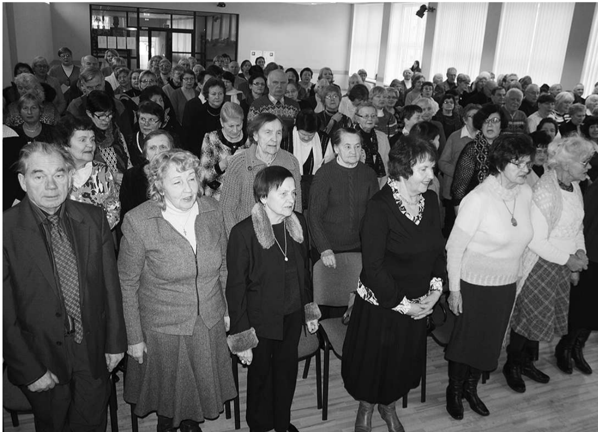
Įnešus TAU vėliavą nuskambėjo senjorų himnas.

Į TAU priimami visi norintieji – nepriklausomai nuo išsilavinimo bei socialinės padėties. Lankydami užsiėmimus žmonės ne tik įgyja žinių, bet daug dėmesio skiriama bendravimui – kartu švenčiamos Kalėdos, Velykos, organizuojamos vakaronės, koncertai, jubiliejai, keliaujama po Lietuvą. Baigusiems TAU išduodami tai patvirtinantys pažymėjimai, tačiau senjorams nereikia laikyti egzaminų, įskaitų.